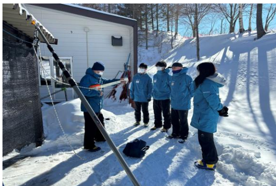
【冬季シーズン救助訓練】