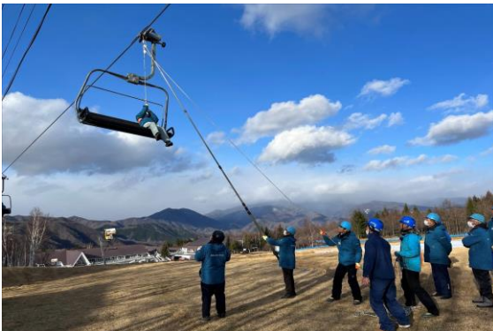
【冬季シーズン救助訓練】